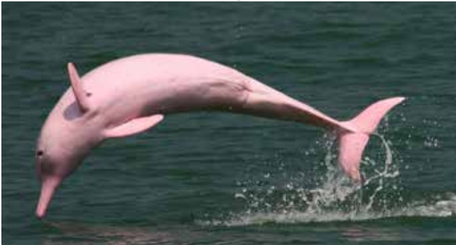
Tag 11, Samstag 28. September 2024 IQUITOS

Nach einer 60-minütigen Bootsfahrt erreichen wir die Lodge. Am Nachmittag unternehmen wir eine Wanderung durch das primäre Regenwaldreservat Yanamono, begleitet von erfahrenen Guides, für etwa zwei Stunden. Wir werden verschiedene Pflanzenarten wie Helikonien, Heilpflanzen und Riesenbäume und verschiedene Vogelarten beobachten. Rückkehr zur Lodge, um den atemberaubenden Amazonas-Sonnenuntergang zu erleben. Wenn die Dunkelheit hereinbricht, machen wir eine Bootsfahrt für einen aufregenden Abend im Dschungel. Ohne Lichter fahren wir zu Stellen, wo wir die magischen Klänge des Dschungels genießen können. Anschließend Rückkehr zur Lodge, um uns für einen frühen Start am nächsten Tag auszuruhen. Abendessen und Übernachtung.