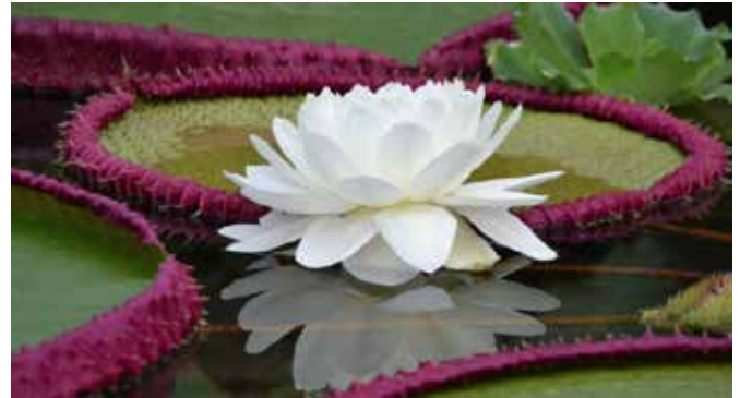
Tag 13, Montag 30. September 2024 IQUITOS - LIMA

Abfahrt mit dem Boot zu einem See auf der Insel Yanamono, wo wir die Riesenseerose, die Victoria Regia , die "Königin der Seerosen", sehen können. Jetzt als Victoria Amazonica bekannt. Wir könnten einige weiße Blüten sehen, die in der ersten Nacht blühen, und andere, die in der zweiten Nacht nach der Blüte rosa werden. Sie können einen Durchmesser von einem Meter erreichen und werden von Käfern bestäubt. Victoria Amazonica ist bekannt für ihre riesigen kreisförmigen Blätter. Rückkehr zur Lodge zum Mittagessen. Am Nachmittag besuchen wir eine traditionelle Zuckerrohr-Destilliererei, um den Prozess der Zuckerrohrsaft-Destillation kennenzulernen. Rückkehr zur Lodge. Abendessen und Übernachtung.