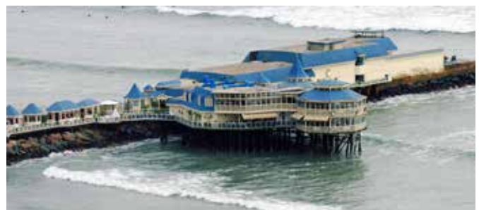
Tag 14, Dienstag 01. Oktober 2024 LIMA - MADRID

Am Morgen, wer Lust haben sollte, kann eine Rafting-Tour auf dem Amazonas machen. Es ist eine aufregende und sichere Aktivität, bei der Sie auf dem größten Fluss paddeln und eine Seitenwanderung in den überfluteten Dschungel oder in kleine Nebenflüsse des Amazonas unternehmen können. Betrachten Sie langsam und leise den Reichtum der Natur, ohne den Lärm, der Tiere und Vögel erschreckt. Rückkehr zur Lodge zum Mittagessen und Check-out. Nach dem Mittagessen Transfer zum Flughafen für den Flug nach Lima. Ankunft und Transfer zum Hotel. Abendessen im Restaurant "La Rosa Nautica" am Meer. Übernachtung.